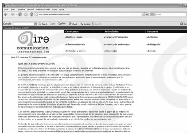
Educomunicación en Aire Comunicación ( http://www.airecomun.com/educocomun.htm ).

Partiendo de que todo acto humano es una forma de comunicación, de que los medios de comunicación ocupan un lugar central en nuestra sociedad y de que la verdadera educación debe seguir siendo el proceso transformador de hombres y mujeres, desde estas líneas de trabajo esta asociación