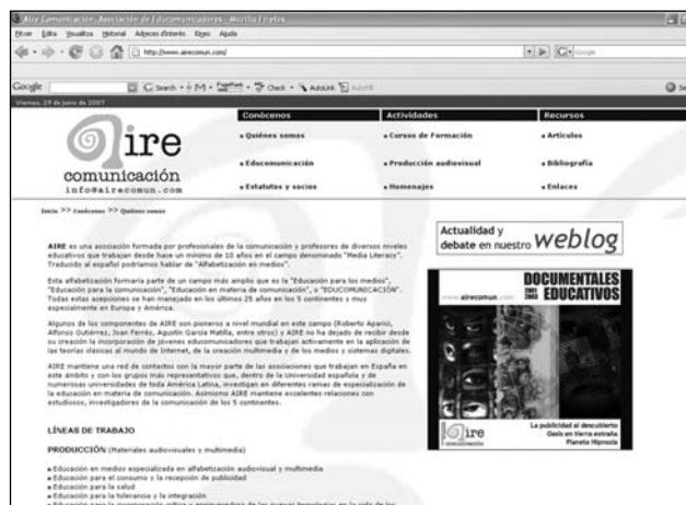
Aire Comunicación ( http://www.airecomun.com ).