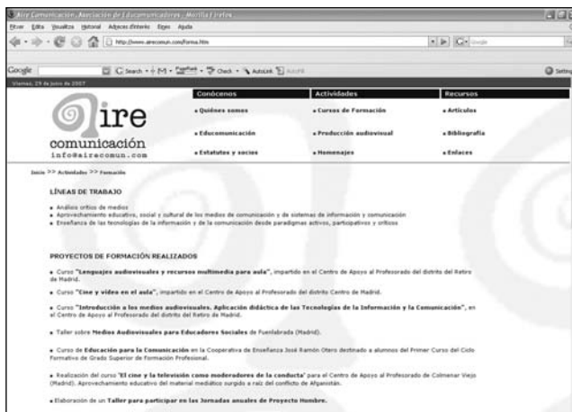
Formación en Aire Comunicación ( http://www.airecomun.com/forma.htm ).